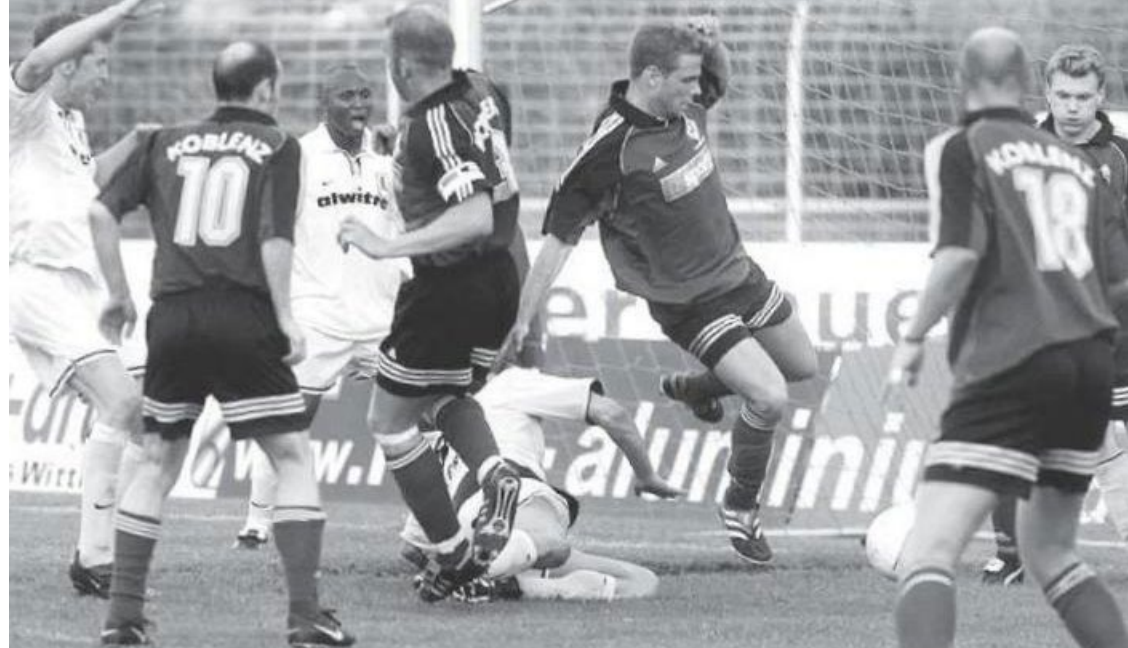
Umkämpfte Szene aus dem ersten Duell in einem Rheinlandpokalfinale: TuS Koblenz (dunkle Trikots) unterlag 2001 dem SV Eintracht Trier nach Elfmeterschießen.

U nd ein Elfmeterschießen musste auch in Salmrohr herhalten, um einen Sieger zu ermitteln. An dieser Spielstätte hatte sich die Eintracht drei Wochen zuvor noch recht souverän gegen den FSV durchgesetzt. Genau diese Souveränität vermissten nun die 1.200 Zuschauer – oder zumindest jene, die ihre Sympathien den Linz-Schützlingen schenkten. Denn die TuS war nicht nur das bessere Team. Sie zeigte auch die beste Leistung der gesamten Saison. Bemerkenswert nach über 40 Saisonspielen bis zu diesem Zeitpunkt. Und fast hätte es sogar gereicht.