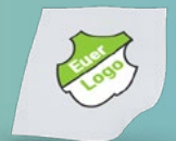
STICKER AB 0,01€