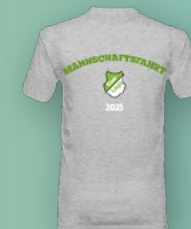
T-SHIRTS AUF ANFRAGE