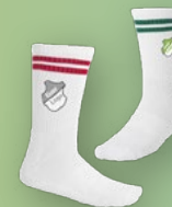
TENNISSOCKEN AB 5,20€