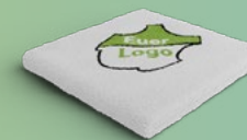
HANDTÜCHER AB 8,50€