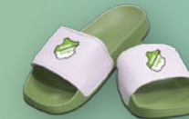
BADELATSCHEN AB 17€